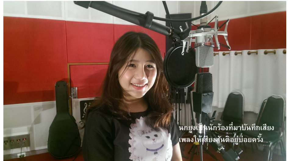
นกยูงเป็นนักร้องที่มาบันทึกเสียงเพลงให้เสียงสันติอยู่บ่อยครั้ง

ปี 2016 จำนวนสถานีวิทยุกระจายเสียงในประเทศที่นำรายการของเสียงสันติไปออกอากาศ ได้เพิ่มขึ้นอย่างรวดเร็ว ในปี 2017 พบว่ามีจำนวนสถานีวิทยุมากกว่า 123 สถานีที่ลงทะเบียนเป็นสมาชิกกับเสียงสันติ เพื่อสามารถดาวน์โหลดรายการวิทยุต่างๆของเสียงสันติไปออกอากาศในสถานีวิทยุของตัวเอง ทั้งที่เป็นสถานีวิทยุชุมชน สาธารณะและธุรกิจ