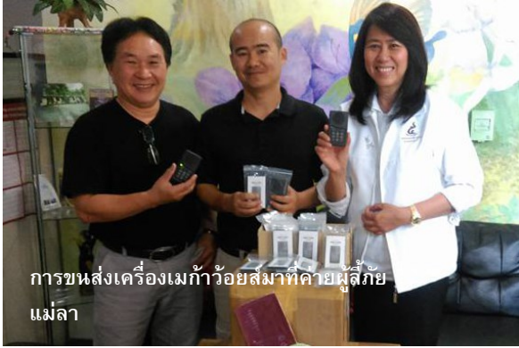
การขนส่งเครื่องเมก้าว้อยส์มาที่ค่ายผู้ลี้ภัยแม่ลา