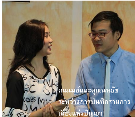
คุณแม่และคุณหน้ ระหว่างการบันทึกรายการ เสียงแห่งปัญญา

ด้วยความต้องการที่เพิ่มมากขึ้นของเสียง สันติทำให้ฝ่ายรายการต้องทำงานกันน้อยย งหนัก เพราะรูปแบบที่ใช้อยู่ในรายการวิทยุ ส่วนใหญ่ นั้นยังคงต้องการรายการใหม่ทุก วัน