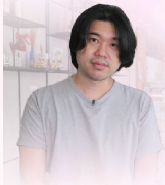
คุณปัญญา ปคุณปัญญา นักแต่งเพลง ผู้ร่วมริบใช้พันธกิจ W501 IIละ: Crossover